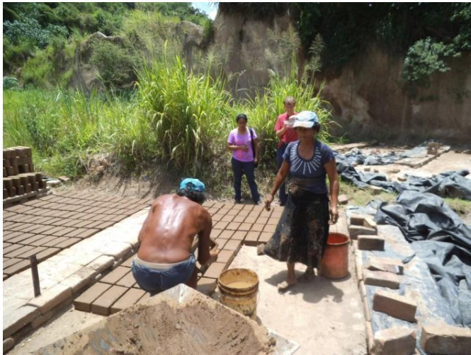
Arbeit in der Ziegelei

für Gespräche mit uns Zeit nahmen, gilt hier ein besonderer Dank. Weiterhin bedanken wir uns beim Bistum Hildesheim, dass diese Begegnungsreise finanziell unterstützt hat. All diese Erfahrungen motivieren uns, hier in Deutschland wieder verstärkt für diese Partnerschaft zu werben und uns für sie einzusetzen.