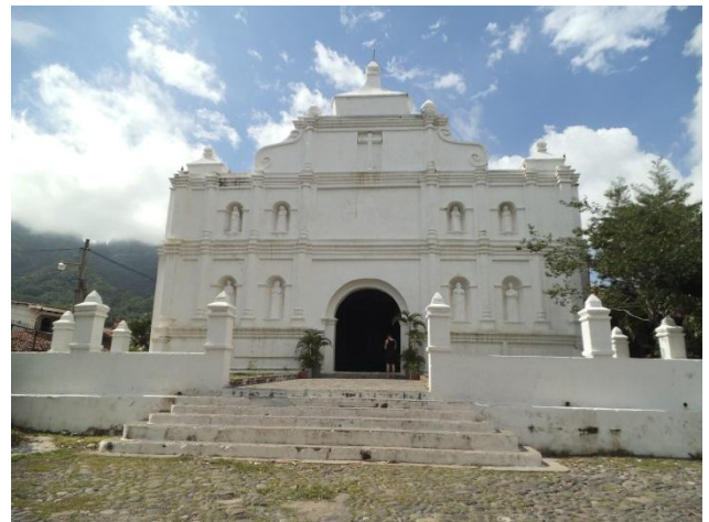
Älteste Kolonialkirche El Salvadors in Panchimalco

Das äußere Bild ist unverändert: Nur noch rechts und links von der alten Bahnlinie, die nicht mehr befahren wird, gibt es Hütten aus Holzabfällen, Plastikplanen und rostigem Wellblech. Ansonsten dominieren wie schon vor zehn Jahren ein- und zweistöckige Gebäude aus Stein mit flachen Dächern aus Wellblech oder Eternit. Sie stehen teilweise auf unsicherem Grund und sind dann besonders erdbebengefährdet. Überall gibt es kleine Läden und an der Hauptstraße Verkaufsstände für Obst. Besonders Frauen, Kinder und Jugendliche bestimmen das Bild. Immer wieder begegnet man auch Betrunkenen, die durch ihre Aufdringlichkeit unangenehm werden können. Man sollte ihnen aus dem Weg gehen.