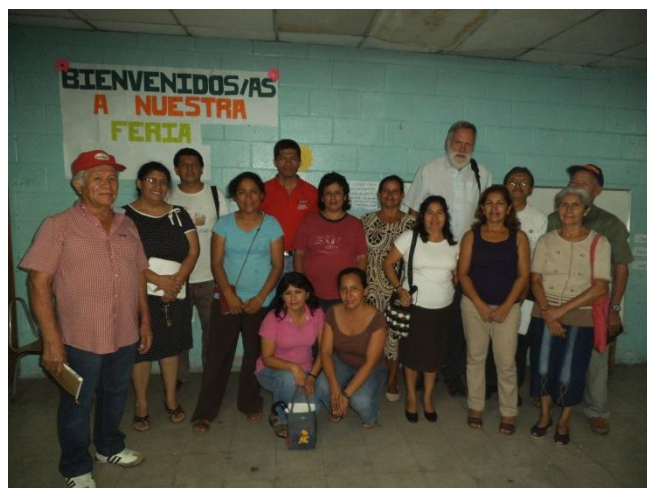
Die Generalversammlung des Trägervereins „Jean Donovan“

Im Unterschied zu früher gibt es zurzeit keine Kämpfe zwischen rivalisierenden Jugendbanden in der Colonia 22 de abril. Da liegt daran, dass die Mara Salvatrucha die rivalisierende Mara 18 vertrieben hat und jetzt dieses Viertel kontrolliert. Die Mara Salvatrucha versteht sich als Schutzmacht und geht gegen andere Kriminelle (z.B. Räuber) gewaltsam vor. Mareros, erkennbar an ihren Tätowierungen, waren immer wieder sichtbar, standen zusammen in kleinen Gruppen, reagierten auf Begrüßungen teils freundlich, teils „beäugten“ sie uns skeptisch mit kalten Blicken. Insgesamt fühlten wir uns sicherer als bei vorherigen Besuchen, gab es doch nachts keine beunruhigenden Geräusche (z.B. Schüsse) und keine für uns wirklich brenzligen Situationen.