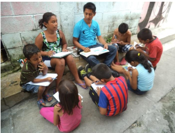
Schule unter freiem Himmel

Die Schule unter freiem Himmel wird sehr stark von Kindern und Jugendlichen aufgesucht. Dieses Projekt hat nach unserer Beobachtung viel Erfolg. Sie findet nicht mehr wie früher vormittags, sondern jetzt nachmittags von 14.00 bis 17.00 Uhr statt. So können sowohl Schulkinder nach ihrem Unterricht kommen als auch Kinder, die keine Schule besuchen. Die Lehrkräfte machen aktiv Lernangebote. Die Kinder können aber entscheiden, ob sie diese annehmen oder sich selbstständig mit den mitgebrachten Materialien befassen. Kinder und Jugendliche konzentrieren sich nach meiner Beobachtung sehr auf ihr Spiel und das, was sie lernen wollen. Sie müssen sich hier nicht um Materialien streiten, da genug davon da sind, und lernen –auch in gemeinsamen Spielen– einen friedlichen Umgang miteinander.